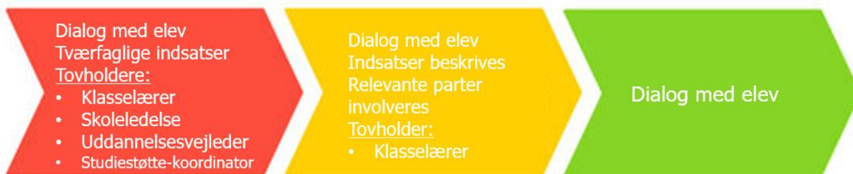
Figur 1 Trivselsmodellen. Indsatstriagering.

Såfremt eleven vurderes rød er der flere indikatorer på mistrivsel eller direkte frafaldstruet. Når eleven er rød er det fastlagt i gruppen at der skal igangsættes et tværfagligt samarbejde om fastholdelse/afklaring. Dvs. ansvaret må ikke påhvile den enkelte klasselærer eller ansvarlige. Der bliver i denne foranledning også igangsat og dokumenteret specifikke indsatser til hvordan eleven kan hjælpes.