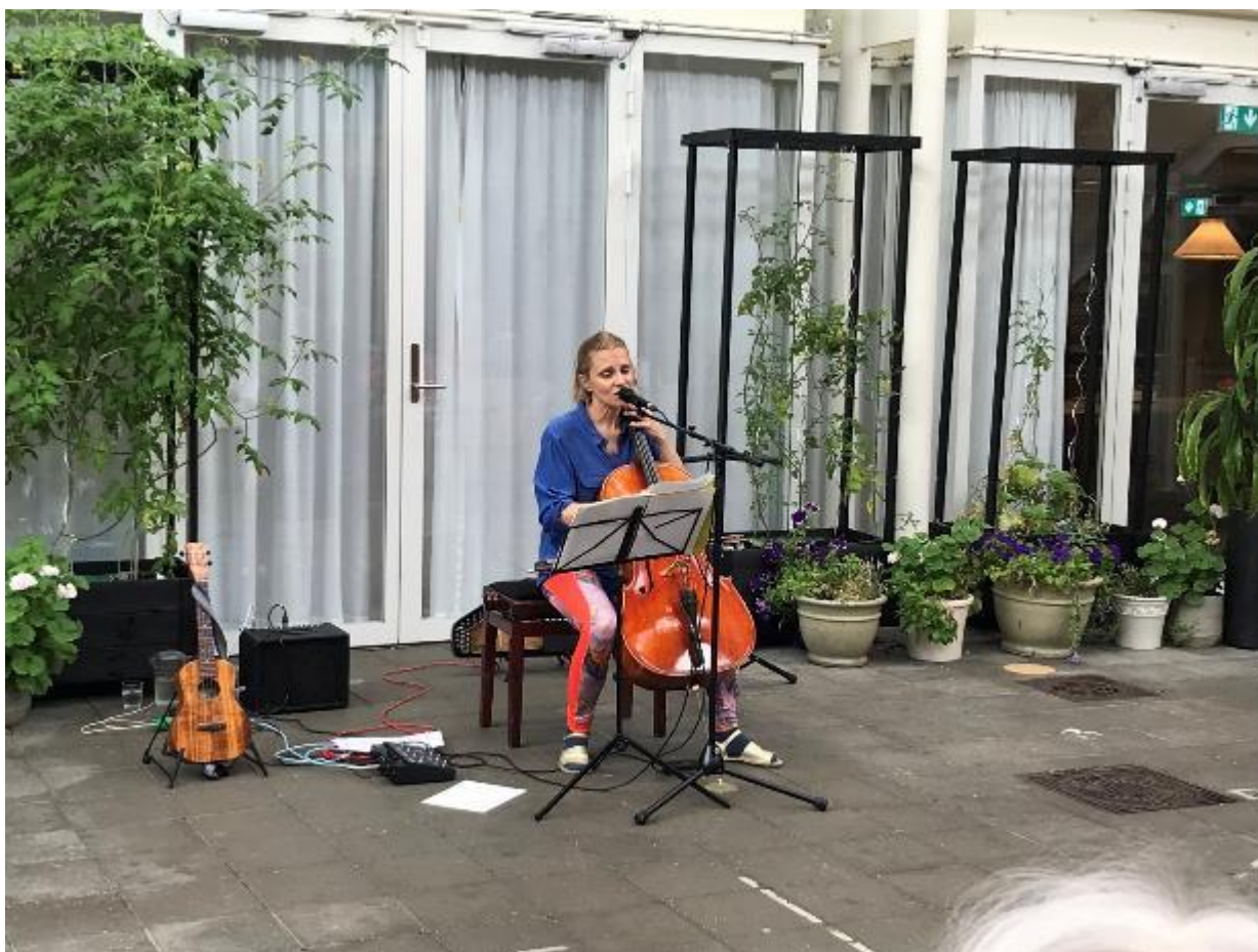
Koncert med cello og sang den 17. juli.

Tak til lokale aktører for at tænke på Salems beboere!