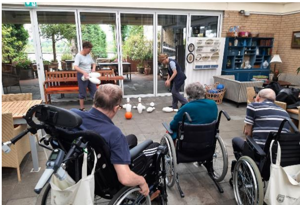
Forskellige spil i Atriumgården i anledning af OL.