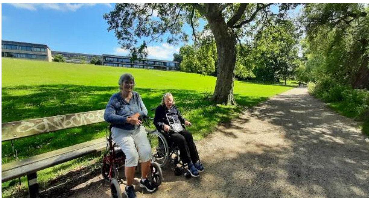
Sommergatur ved Gentofte Sø.