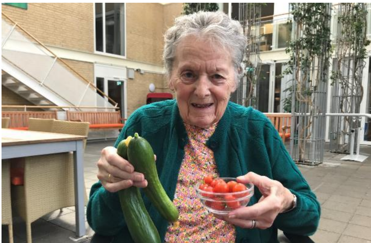
Noget af sommerens sidste høst fra agurke- og tomatplanterne i Atriumgården.