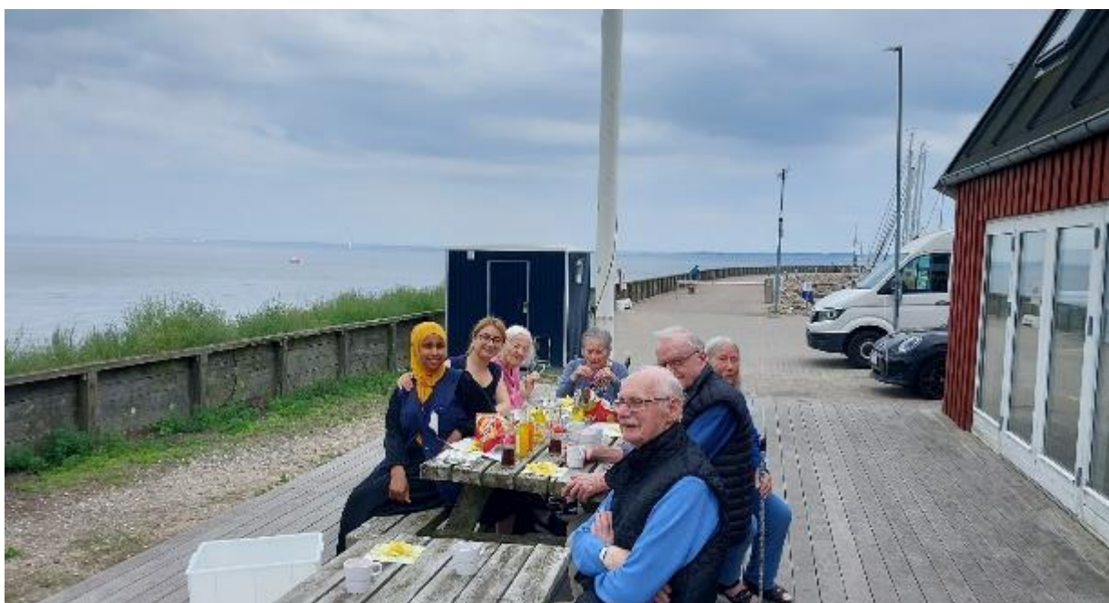
Beboerne fra stueetagen på udflugt til Skovshoved Havn med forfriskninger