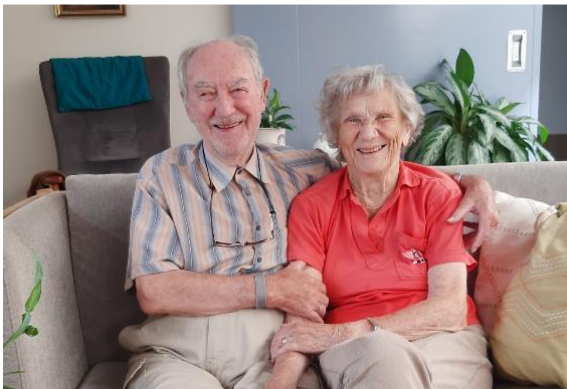
Besøg af kære familiemedlemmer er altid populært.