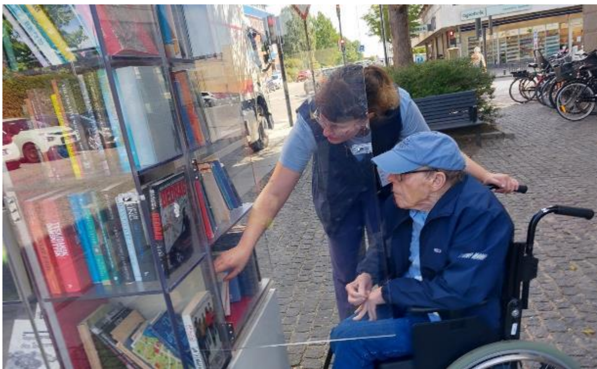
Bogskabet ved Gentoftgade med gratis bøger blev studeret på en tur i området.