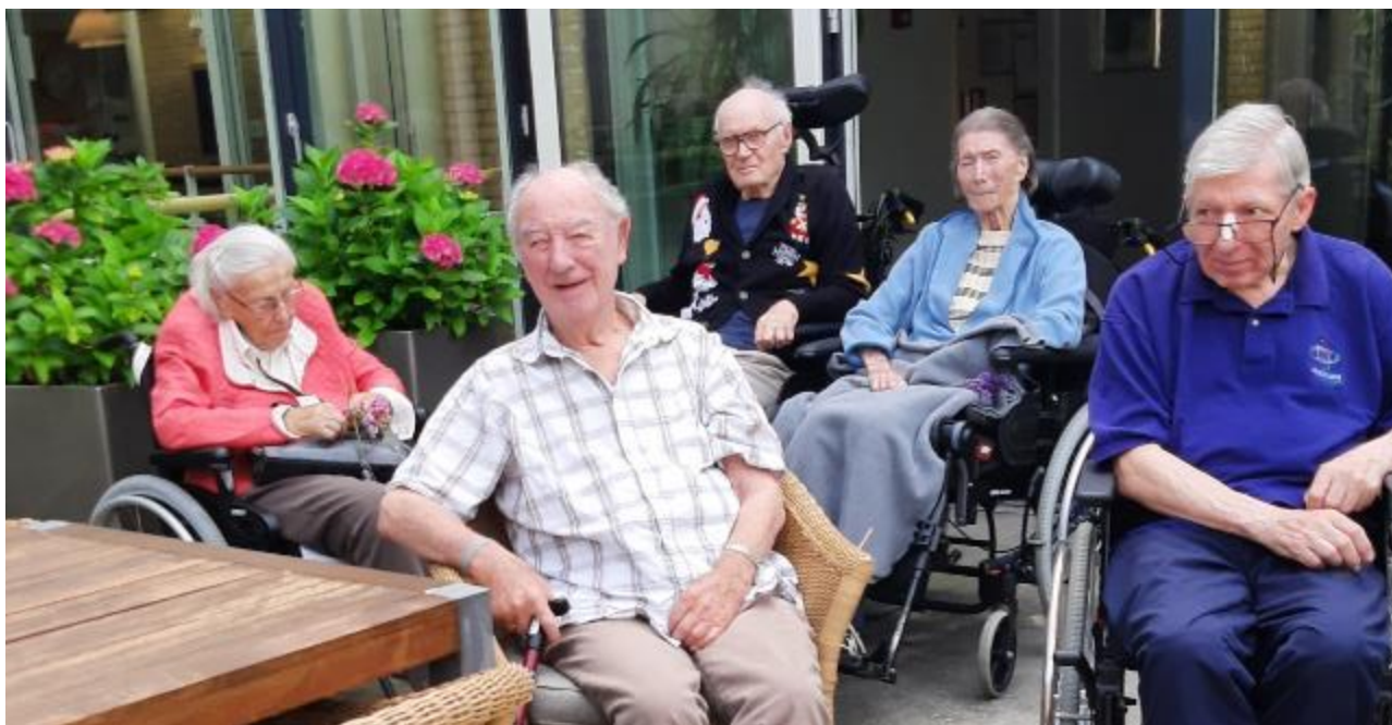
En sommereftermiddag på terrassen på 1. sal.