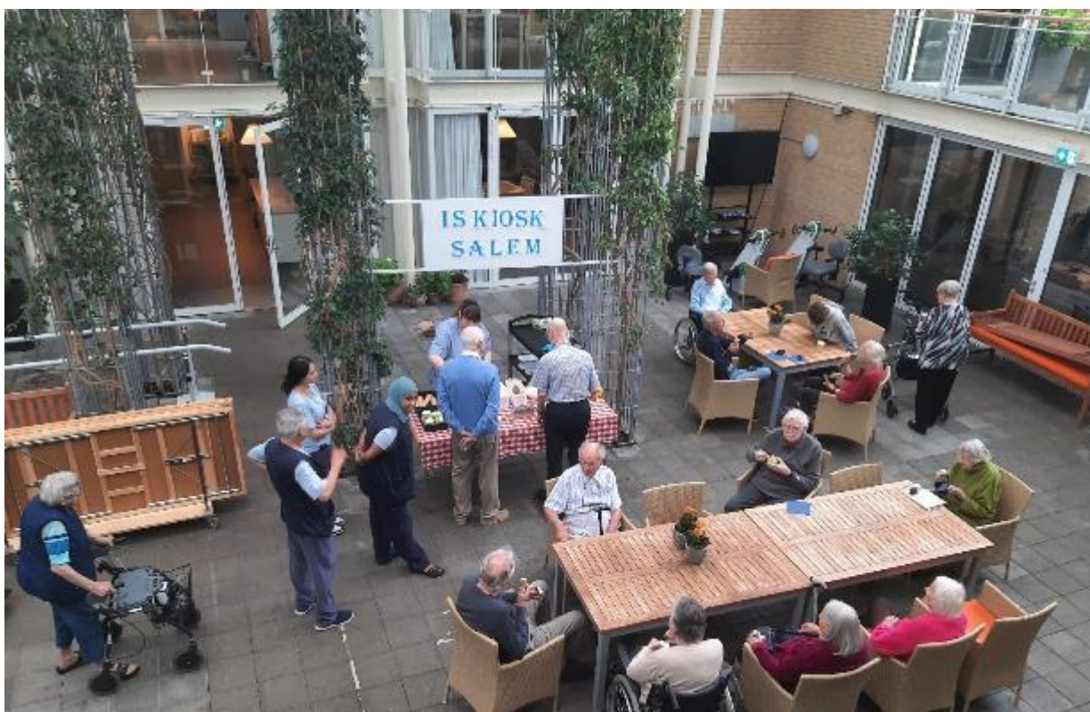
Den rødternede dug var på plads i Salems Iskiosk og udvalget af forskellige is og topping stod klar, de gange kiosken holdt åbent i sommermånederne.