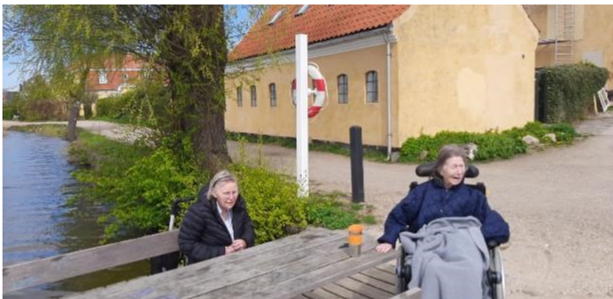
Gåture i maj