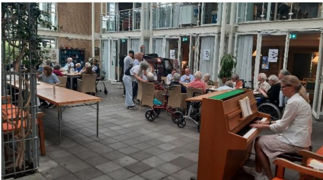
Kaffevogn og klaverspil i maj