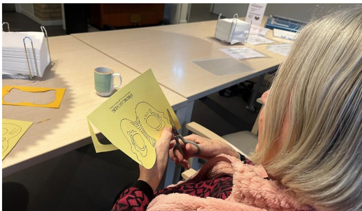
Der hygges med fastelavns forberedelser i MH