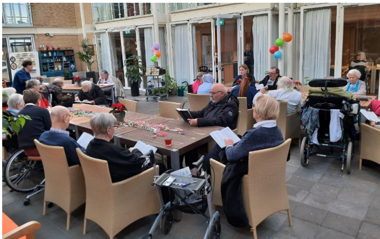
Nytårskoncert i Atriumgården var flot besøgt af både beboere og ansatte.