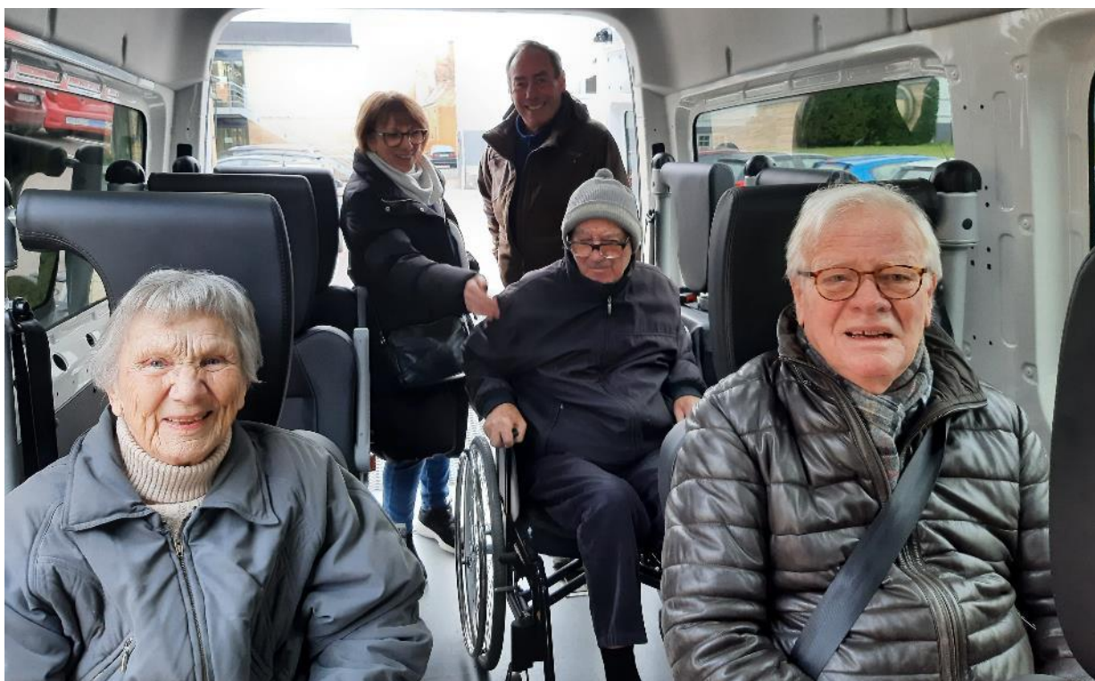
Udflugt i bussen til Statens Naturhistoriske Museum – det tidligere Geologisk Museum d. 29. januar.