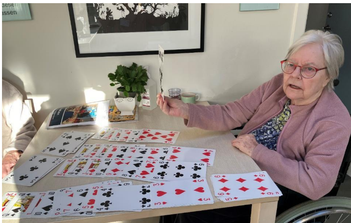
Kabale i Annettes Have