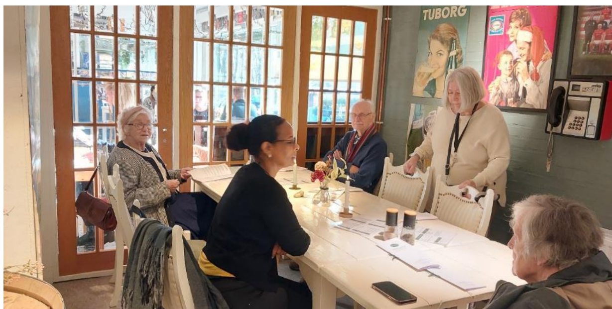
Udflugt til Højris med frokost og mange minder på væggene fra før i tiden.