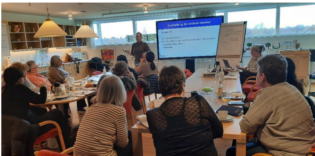
Alle Salems medarbejdere er i gang med at gennemføre modul 6 af VækstKultur-kursusforløbet. Dette modul handler om arbejdet med mennesker, som er i sorg eller krise.